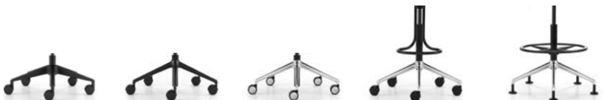
_1 Fünfsternfuss, Kunststoff schwarz, Rollen Piétement à 5 branches, matière synthétique noire, roulettes